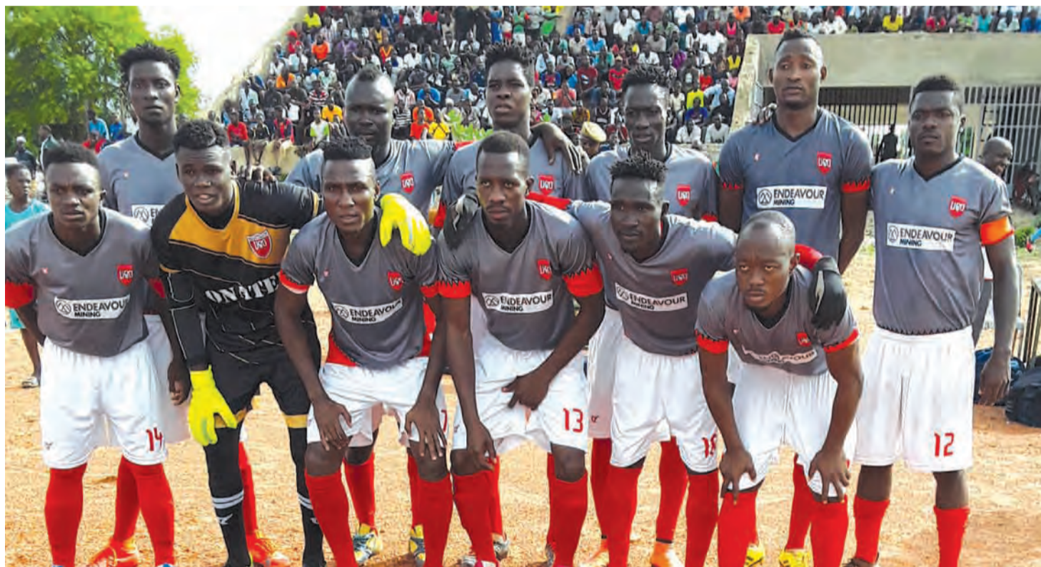
L'USO a fait preuve de force mentale pour aller assurer son maintien à Banfora.

S'il y a un club qui s'est fait une très grande frayeur cette saison, c'est bel et bien l'Union sportive de Ouagadougou (USO), ou les «Rouge et blanc» de Larlé. Il a flirté tout au long de la saison avec la menace de relégation. Et c'est même lors de l'ultime journée, qu'elle a assuré son maintien. Chronique d'un parcours tumultueux.