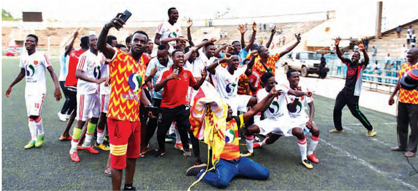
Les joueurs Rahimo FC manifestant leur joie pour le sacre.

Très loin dans les pronostics en début de saison, Rahimo FC a surpris plus d'un en réalisant le doublé, championnat national de football-coupe du Faso. Si l'exploit semble précoce pour l'équipe qui est montée en D1 qu'il y a seulement trois ans, sa réussite s'explique par une bonne organisation et un dévouement de son effectif.