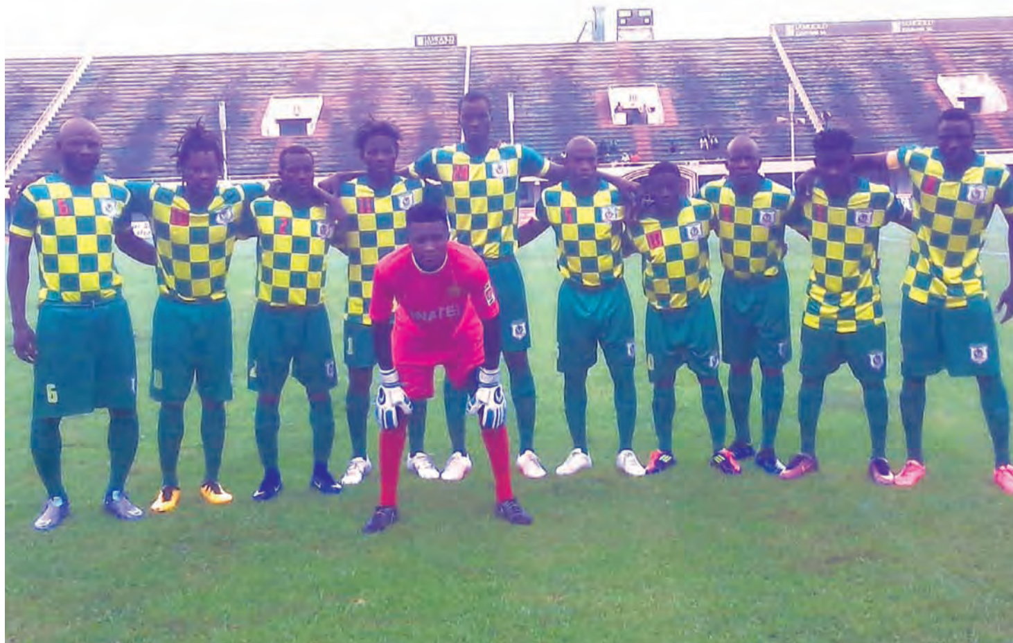
... et l'ASFA-Y ne se réorganisent pas, leur survie est menacée.