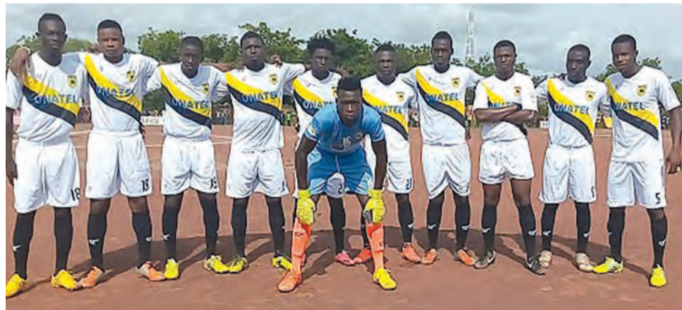
L'ASFB a obtenu son maintien à l'avant-dernière journée.

considération», a-t-il affirmé. Passé les 9 matches sans victoire, sur demande des supporters, il s'est tenu une assemblée extraordinaire. Au cours de celle-ci, le président du comité directeur est revenu sur la situation du club quand il venait aux affaires. «Nous avons fait comme on pouvait. Aujourd'hui, je suis à ma 4e année. Le salaire mensuel de l'ASFB